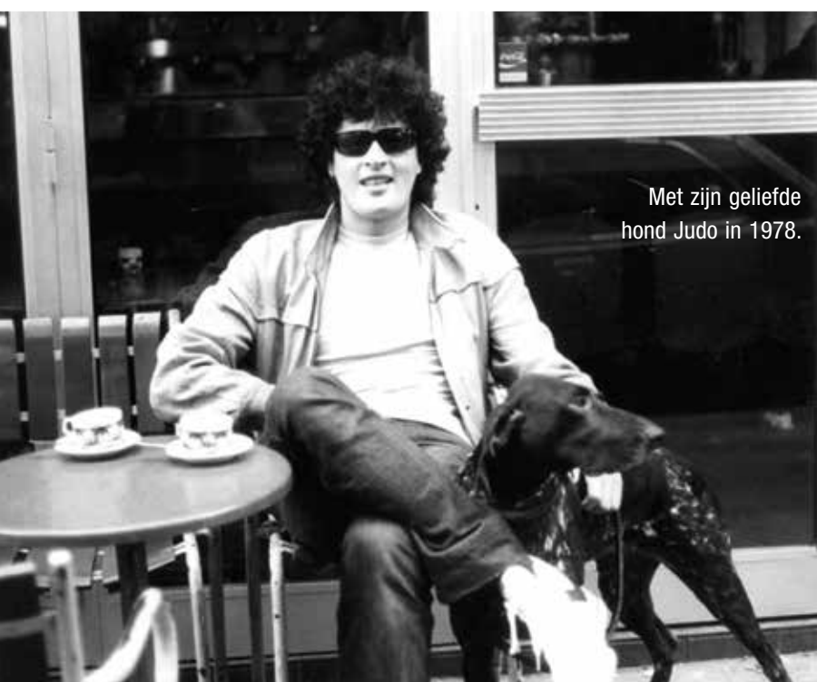
Met zijn geliefde hond Judo in 1978.

‘Van de dood van mijn hond heb ik meer verdriet gehad dan van de dood van mijn moeder’