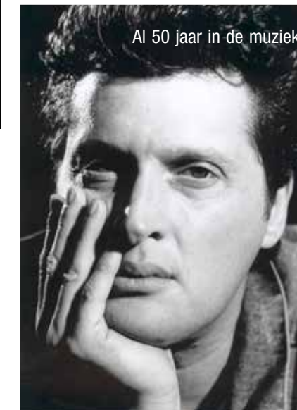
Al 50 jaar in de muziek.