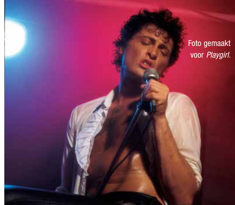
Foto gemaakt voor Playgirl .